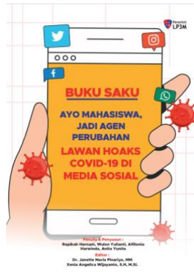
Gambar 2. Cover Buku Saku Ayo Mahasiswa, Jadi Agen Perubahan Lawan Hoaks Covid-19 di Media Sosial