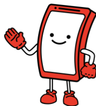
Gambar 3. Maskot Buku Saku Bernama SOLIT

Sumber: Data Olahan Perancang Karya, 2022