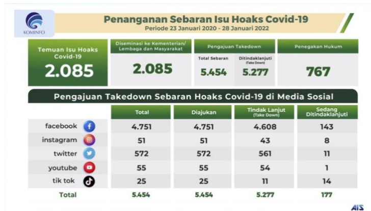
Gambar 1. Infografis Penanganan Sebaran Isu Hoaks Covid-19

konten telah dilaporkan kepada penegak hukum (mth, 2022). Berikut infografis penanganan sebaran hoaks covid-19 di media sosial: